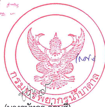
(นางธนัทธ อ่อนสี) พนักงานธุรการ ส ๓